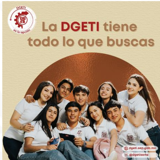
PUBLICACIONES EN REDES